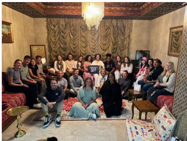
英语系同学海上游学

队开展团创交流学习，探访海外华人、华人公司、华人侨商总会，举办“中国文化日活动”等，充分体验了西班牙与中国不同的文化和教育教学方式，领略了异国美丽的风土人情，也深刻感受到了海外华人的力量，以及中华文化的海外传播力、影响力和感染力。